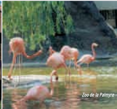
Zoo de la Palmyre